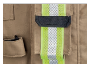
Poche pour radio