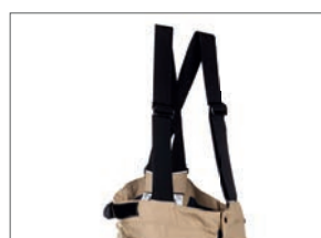
Bretelles réglables et amovibles