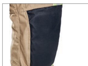
Renforts de genoux ergonomiques intégrés