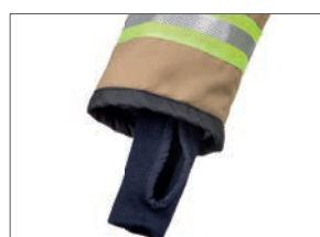
Manchette en tricot avec passe pouce intégré

Cette tenue est la première à être équipée d'une puce RFID pour sa traçabilité et son contrôle.