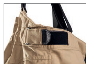
Taille ajustable par boucles