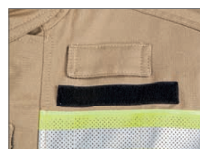
Support multifonctionnel pour lampe et autres outils