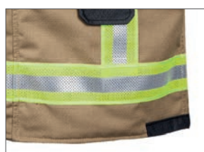
Bandes de signalisation résistantes